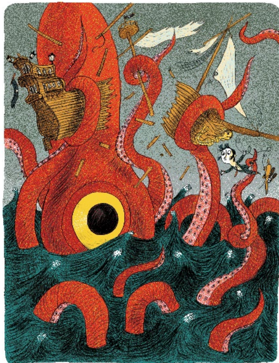
Cuando estaba a punto de escapar de los piratas, casi me convierto en el almuerzo de un calamar gigante.