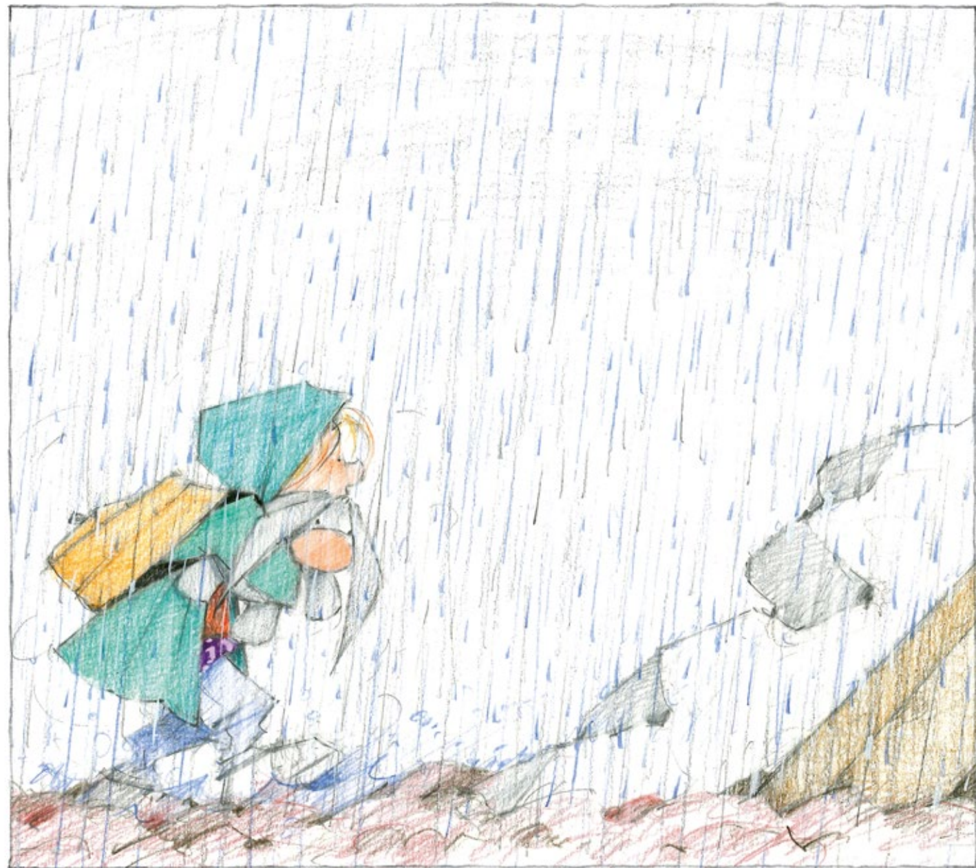
Eta bide luzea egin zuten, euripean.